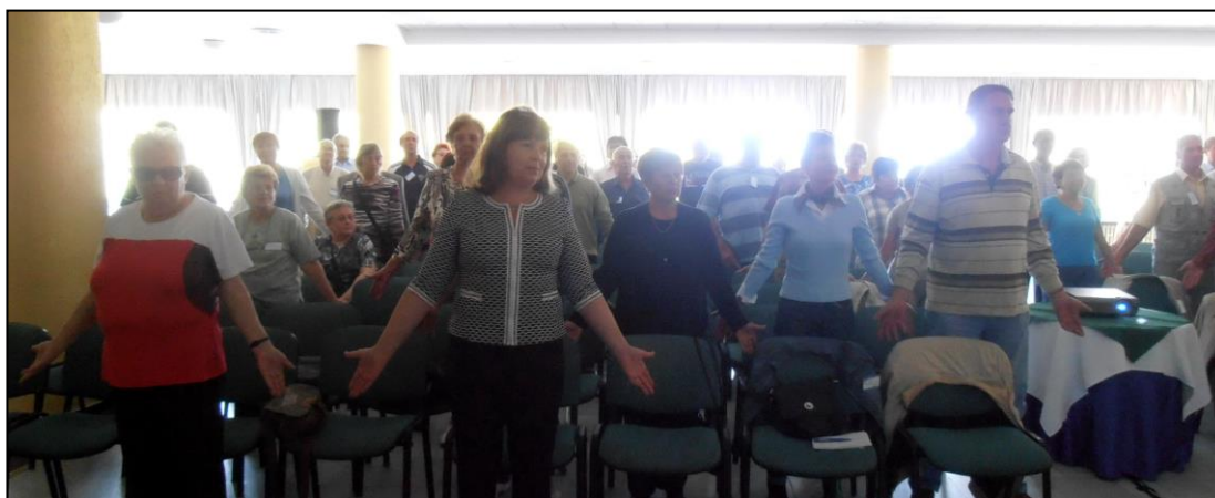
Rozcvička počas prednášok